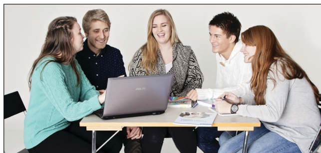
Punktene dere skriver inn i samarbeidsavtalen må være konkrete.

I sluttvurderingen av prosjektet er det derfor viktig å evaluere alle tre faktorene: